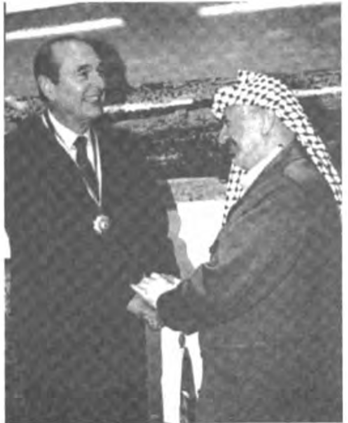
مع الرئيس الفرنسي جاك شيراك